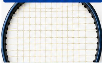
張りたてのガット